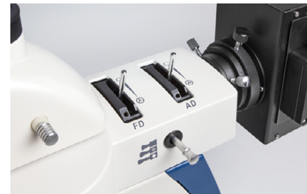
Unità di illuminazione

Semi apocromatiche lenti come accessori disponibili (vedi elenco delle attrezzature dei modelli p. 27)