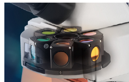
Ruota portafiltri a 6 posti OBN 148